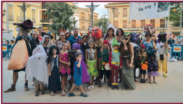
1 ER Premi Comparsa 2017