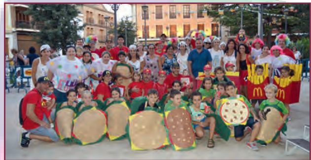
2 ON Premi Carrossa 2017

LES INSCRIPCIONS SERAN FINS AL 4 DE SETEMBRE A L'ESPAI CULTURAL. Cal especificar el nombre total de participants en cada comparsa i el lema de participació.