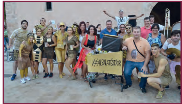
2 ON Premi Comparsa 2017