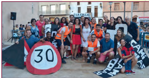
1 ER Premi Carrossa 2017